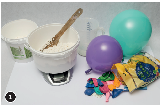
1 Mescolare la cartapesta con l'acqua secondo le indicazioni riportate sul prodotto.