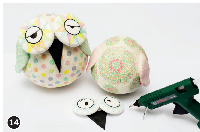
14 Fissare il becco e gli occhi con la pistola a caldo.

Il team creativo OPITEC ti augura buon divertimento!