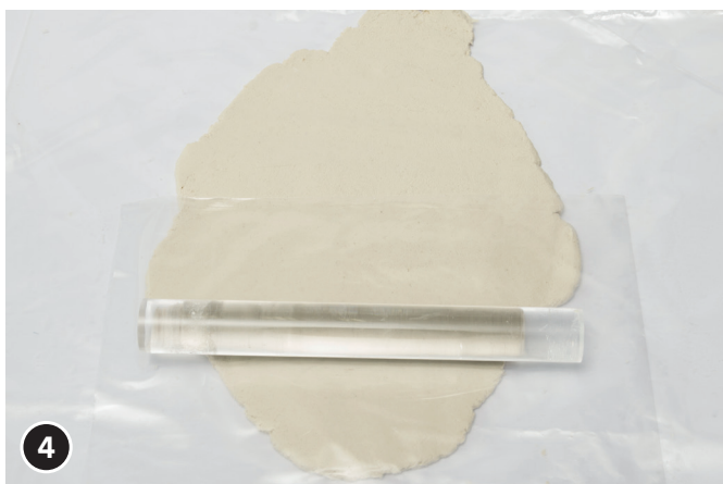
4 Stendere una piastra in cartapesta dello spessore di ca. 5 mm.